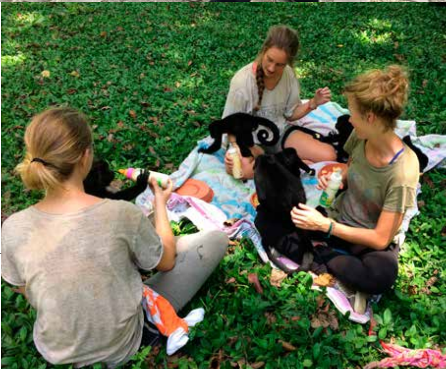
Terrain ethnographique dans le cadre du mémoire bloc 2, dans un centre de réhabilitation pour animaux au Costa Rica, avril 2018