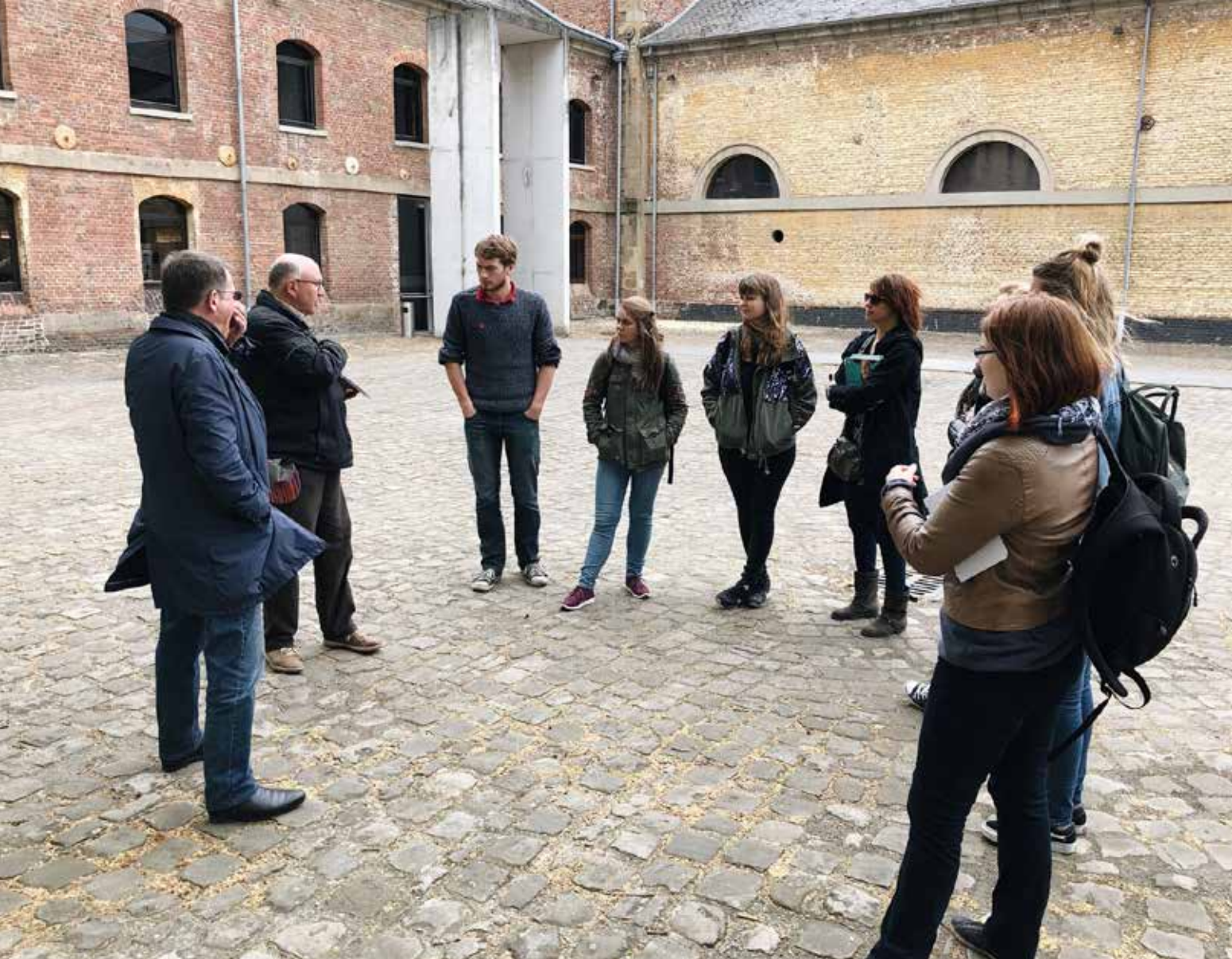
Leçon d'anthropologie urbaine à l'ancien complexe industriel du Grand-Hornu, dans le Hainaut, avril 2018